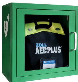
ZOLL AED Plus mit oder ohne Tasche