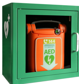
ZOLL Powerheart G5 mit oder ohne Tasche