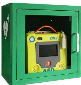
ZOLL AED 3 ohne Tasche